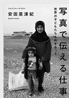
「写真で伝える仕事 —世界の子どもたちと向き合って—」 (日本写真企画)