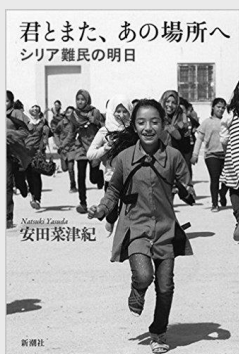
「君とまた、あの場所へ シリア難民の明日」 (新潮社)