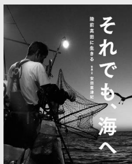
「それでも、海へ —陸前高田に生きる—」 (ポプラ社)